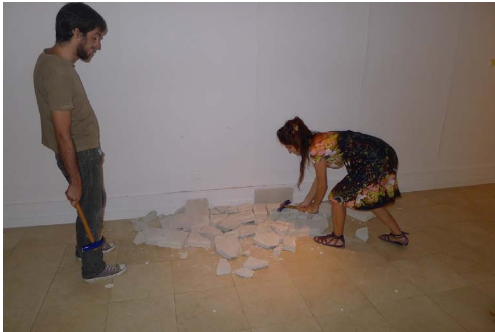
Intervención en el MAS: derribo de un muro de hormigón.

NÚRIA GÜELL (Vidreres, Girona, 1981) CV www.nuriaguell.net